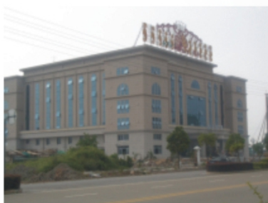
温岭金王朝大酒店